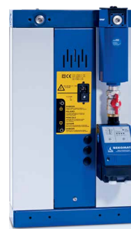
Montáž na zadní straně