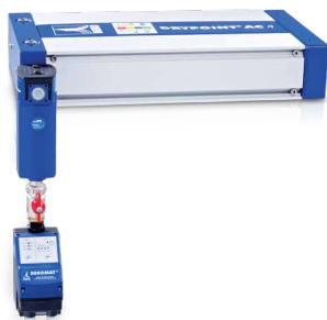
Montáž v horizontální poloze možná

DRYPOINT® AC instalovat horizontálně i vertikálně, takže je k dispozici celkem 20 různých možností montáže. Díky provedení Multivoltage lze sušičku DRYPOINT® AC 119 – AC 196 přímo připojit na každou běžnou napájecí elektrickou síť po celém světě.