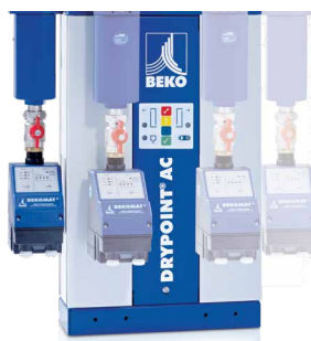
Montáž z boku a na přední straně