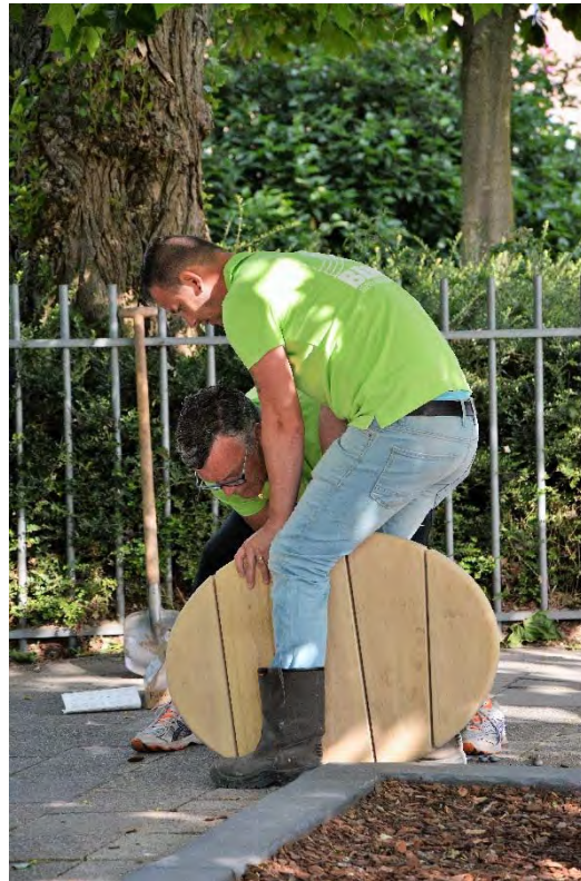
Corporate Social Responsibility | Marketing | MV/sd