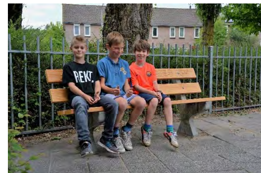
Corporate Social Responsibility | Marketing | MV/sd

Hmmm. De ene hard aan het lachen, de andere aan het zitten. Gelukkig werken ze veel harder op de zaak om alle orders spoedig en correct te verwerken!