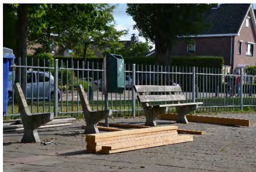
... worden gedemonteerd...