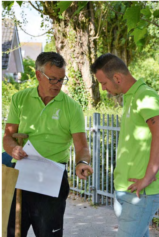
BEKO TECHNOLOGIES. Verantwoordelijk Vooruitgaan