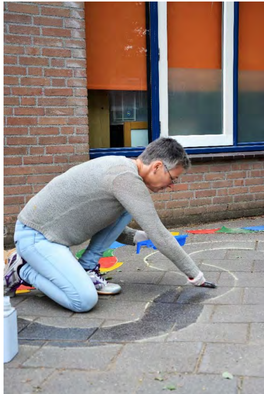
BEKO TECHNOLOGIES. Verantwoordelijk Vooruitgaan