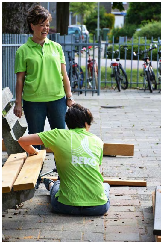
BEKO TECHNOLOGIES. Verantwoordelijk Vooruitgaan