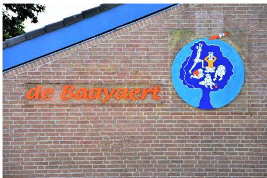
Basisschool De Baayaert, Wouw