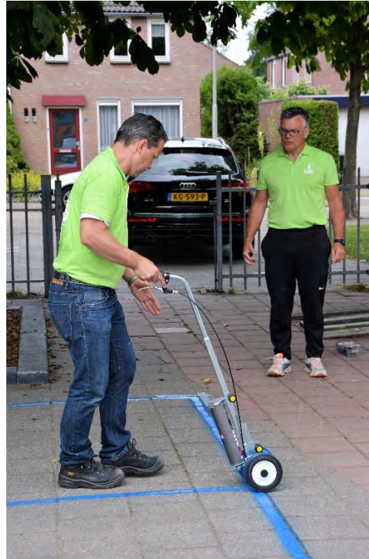
Corporate Social Responsibility | Marketing | MV/sd