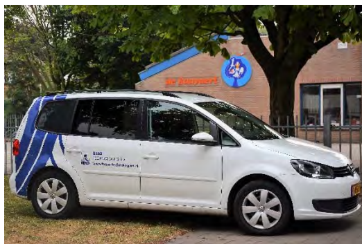
Serviceauto BEKO TECHNOLOGIES B.V.