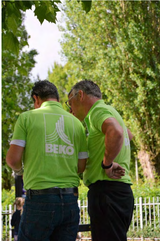
BEKO TECHNOLOGIES. Verantwoordelijk Vooruitgaan