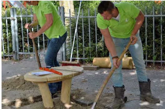
De kuilen voor de zitpaaltjes uitgraven

BEKO TECHNOLOGIES. Verantwoordelijk Vooruitgaan