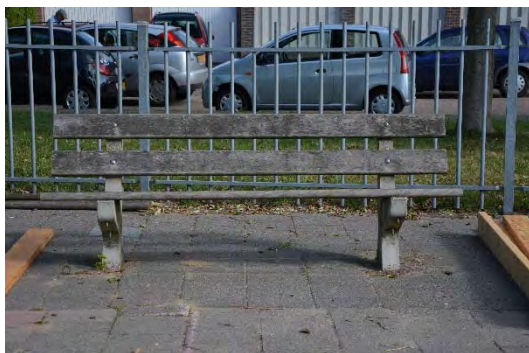
De oude planken...